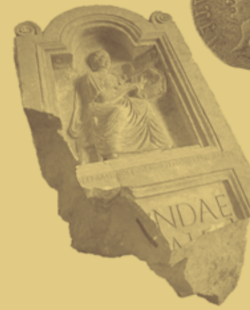
Segobriga, 1. Hälfte 2. Jh. n. Chr.