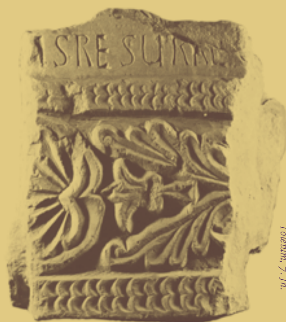
Toletum, 7. Jh.