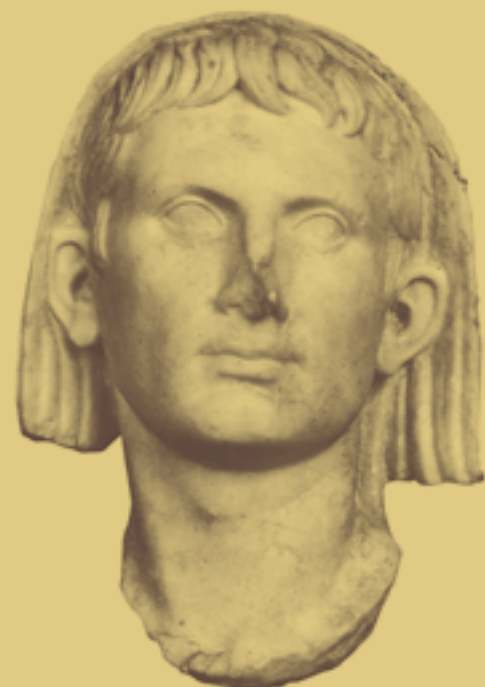
Augusta Emerita, z.Z. des Tiberius