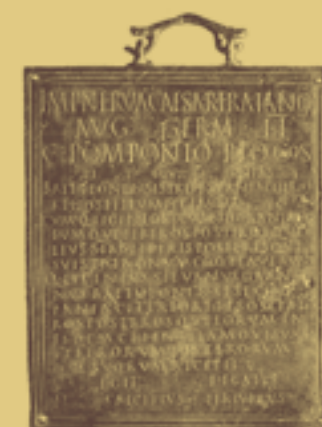
Barubis, 8. Juni 98 n. Chr.