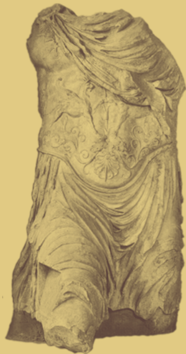
Corduba, z.Z. des Claudius