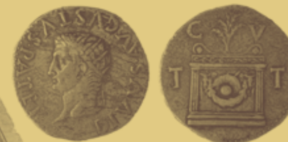
Tarraco, z.Z. des Tiberius